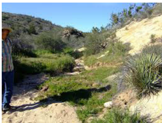
Allan Kaprow, Easy , 1972