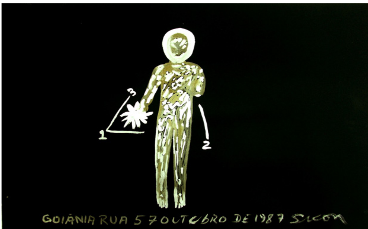
Figura 1: Desenhos de Siron Franco / Césio, Rua 57 (Goiânia, 1987)

No meu critério, as mídias tinham sido cúmplices num momento onde não existiam telefones celulares nem redes sociais e onde o acelerado crescimento da cidade se veria prejudicado pela falta de segurança e de responsabilidade política, tanto do estado quanto da empresa responsável pelos aparelhos que tinham sido abandonados e que acabaram trazendo gravíssimos problemas para a população. Descobri que Goiânia tinha histórias que não queriam ou que não deviam ser conversadas, pelo menos não pareciam de interesse, ou isso queriam que pensássemos. Mas sempre motivados por algo, os assuntos aparecem, os diálogos se produzem, as histórias são contadas, e entendi que as artes eram o espaço de diálogo e reclamação a respeito dos acontecimentos do Césio-137. O artista Siron Franco tinha realizado uma amostra inteira a respeito do acidente radioativo. Dela, só restavam fotografias na internet porque não estavam expostas em nenhuma das galerias de exposição da cidade.