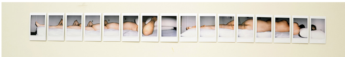
Figura 2- Horizonte II. Odinaldo Costa. 2013.

A obra acima é composta por 16 fotos feitas com uma câmera instantânea modelo Instax Mini da Fuji. O conjunto de imagens tem 95 cm x 8,5 cm e possui as margens brancas características das fotografias instantâneas. A montagem da série Horizonte tenciona um lugar em que o espectador tenha um distanciamento. No caso, ele só veria, a priori, uma linha na parede. Com a aproximação, poderia notar duas imagens justapostas de um homem deitado em uma cama. Gosto do resultado precário das fotografias instantâneas, penso que elas me aproximam do espectador. Composições simples, iluminação pobre – resultado de flash automático, foco simples, todas essas características proporcionam uma consciente despreocupação com as fotografias. O que me interessa é a essência do que está sendo mostrado, e não a técnica pela qual é representado.